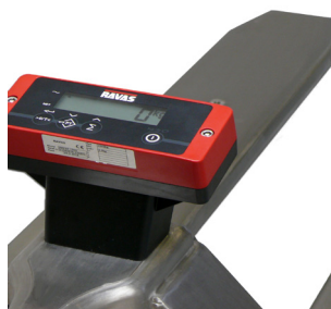
RAVAS 1100 INOX