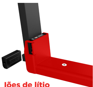
íões de lítio